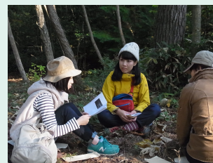
リフレッシュキャンプ