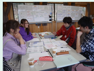
プレイリーダー養成ユースキャンプ