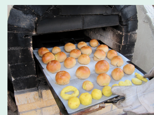
小麦プロジェクト