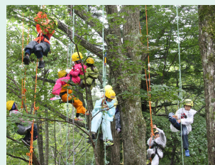
ツリークライミング